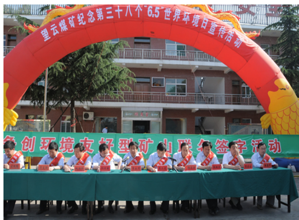
世界环境日开展各种形式宣传活动

▶ 2010 年 1 月，在首届“山西环境保护奖”颁奖典礼上，公司荣获“山西环保减排奖”。