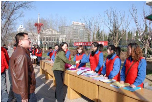
右图为公司青年志愿者参加社会活动

➤ 2009 年 5 月，大阳煤矿分公司开展了“博爱一日捐”活动。此次募捐活动主要用于资助长期生活在贫困线以下的贫特困群体，通过积极的宣传和发动，共收到捐款 48930 元。